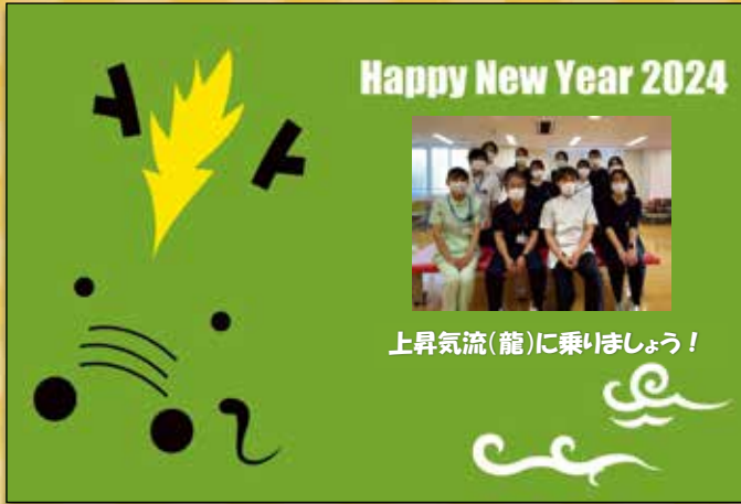
リハビリテーション科