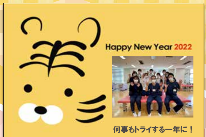
リハビリテーション科