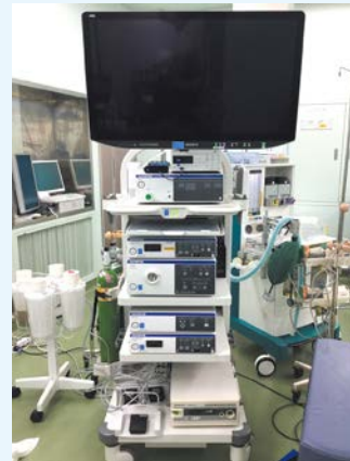
外科手術用 3D 内視鏡システム

※腹腔鏡下外科手術とは、従来の開腹手術に代わり、腹部に開けた数ヶ所の穴から外科手術用内視鏡を挿入し体腔内を観察しながら行う手術です。傷が小さく体の負担が少ないのが特徴です。