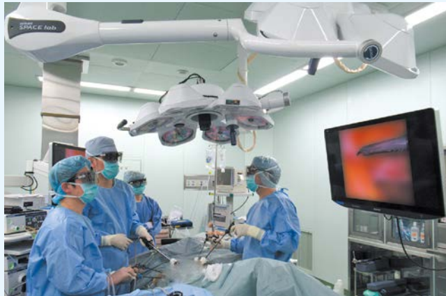
腹腔鏡下外科手術

腹腔鏡下外科手術の更なる精度向上を目的として、最新型 3D 内視鏡システムを導入し、運用を開始しています。この装置を使い 3D 観察を行うことで、従来の平面的な 2D 映像では困難であった対象臓器の奥行き感の把握が容易となります。より迅速で正確な腹腔鏡下外科手術の実現をサポートし、患者さんへの負担がより少ない手術が可能となります。